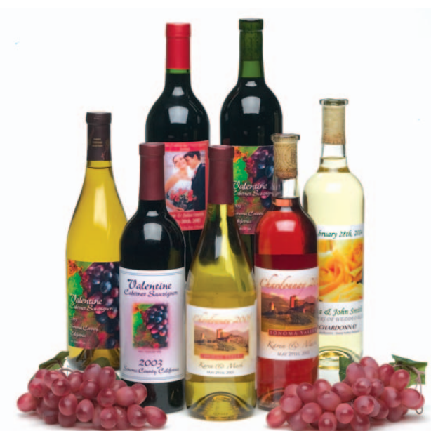
Etiketten für Weinflaschen!

Mit dem LX810 produzieren Sie qualitativ hochwertige, professionelle Etiketten für alle Produkte, die spezielle Kleinauflagen erfordern. Der LX810 ist außerdem hervorragend für den Einsatz als Proof-Drucker für spätere Großauflagen geeignet, nicht zu vergessen Verpackungsetiketten mit Bar-Codes, private Etiketten und den Einsatz bei Werbekampagnen.