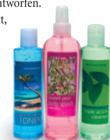
Etiketten für Kosmetikprodukte!

Sie können jede Kombination von Text, Grafiken, Fotos und Abbildungen miteinander verbinden. Jede auf Ihrem Computer installierte Schriftart kann gedruckt werden, was Ihnen maximale Flexibilität und Kreativität bei Ihren Etikettendesigns ermöglicht.