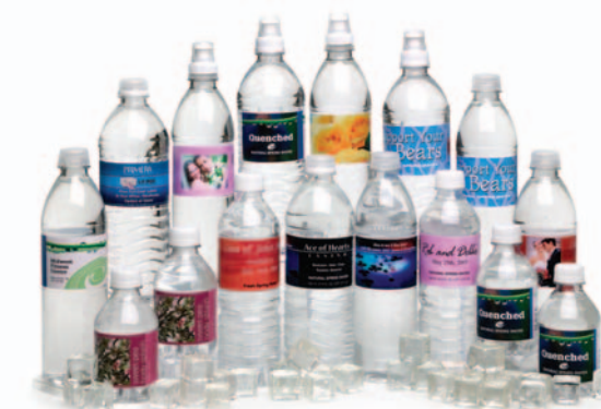
Etiketten für Wasserflaschen!

Der LX810 druckt auf viele verschiedene Materialien einschließlich hochglänzende, matte und seidenmatten Etiketten. Sie können auch Aufkleber, Kunststoffe, Endlospapier, transparentes Polyester und leicht klebbares Material bedrucken. Es gibt sogar Hochglanzetiketten, die hochgradig wasserresistent sind. Sie sind perfekt für Etiketten auf Kisten/Kartons, die Wasser, Regen oder Schnee ausgesetzt werden.