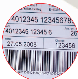
Etikettierung von Paletten und Kartons