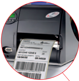
Kommissionierung / Verpackung